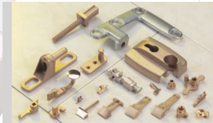
Ensemble d'accessoires pour menuiserie intérieure / extérieure

Les tolérances dimensionnelles serrées et constantes entraînent la réduction des usinages et une diminution du poids des pièces.